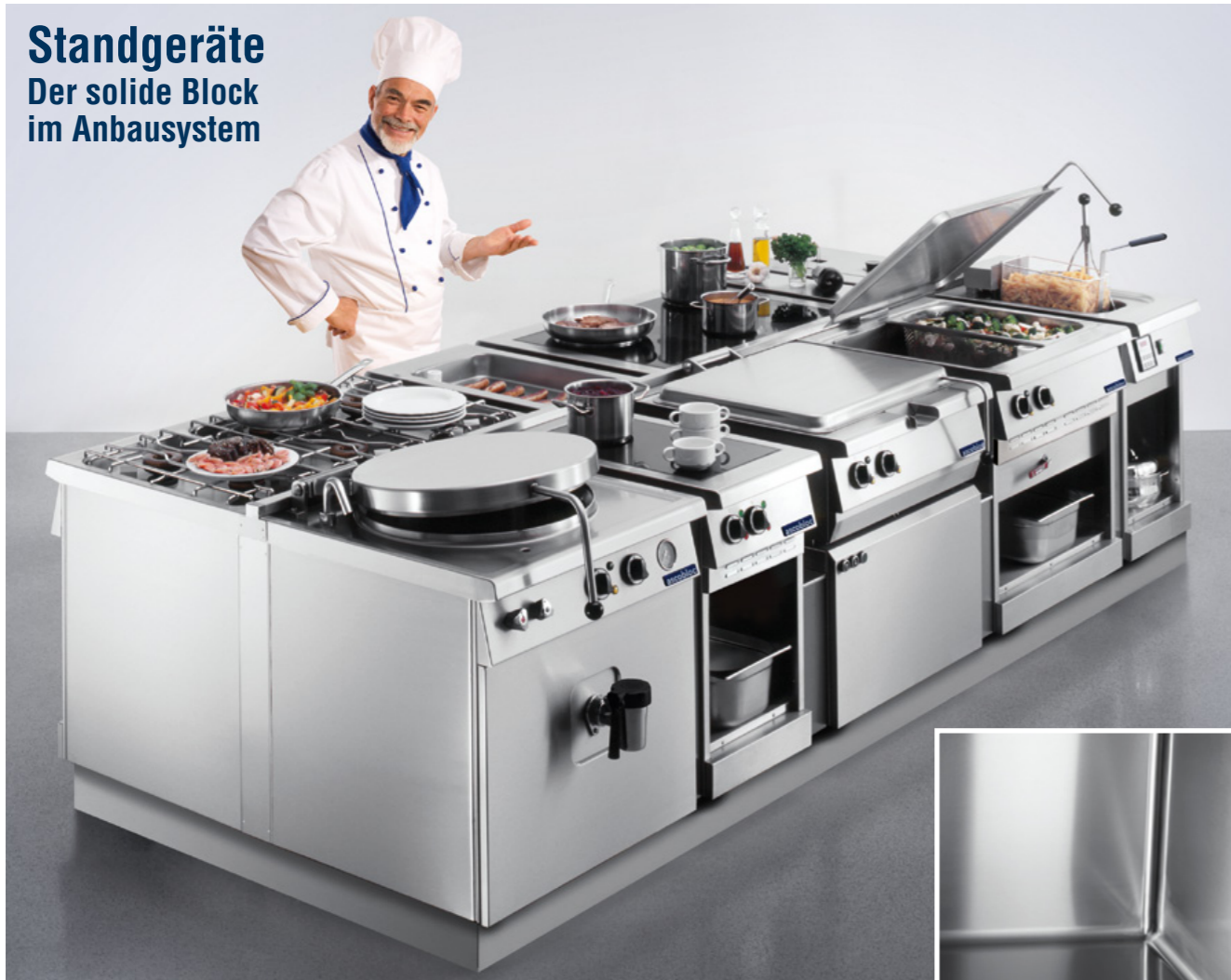
Option: Unterbau Hygiene 2