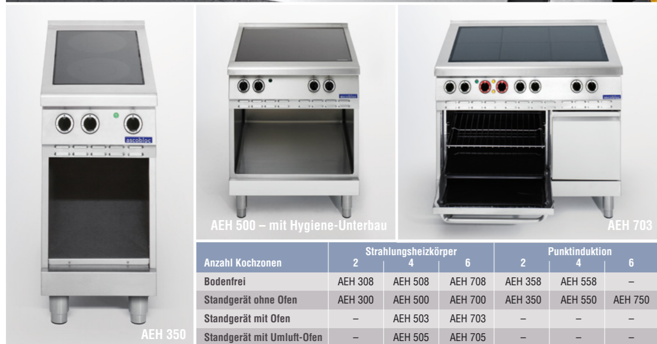
AEH 500 – mit Hygiene-Unterbau